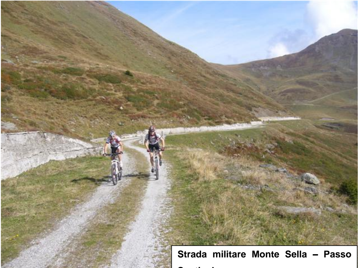
Strada militare Monte Sella – Passo Santicolo