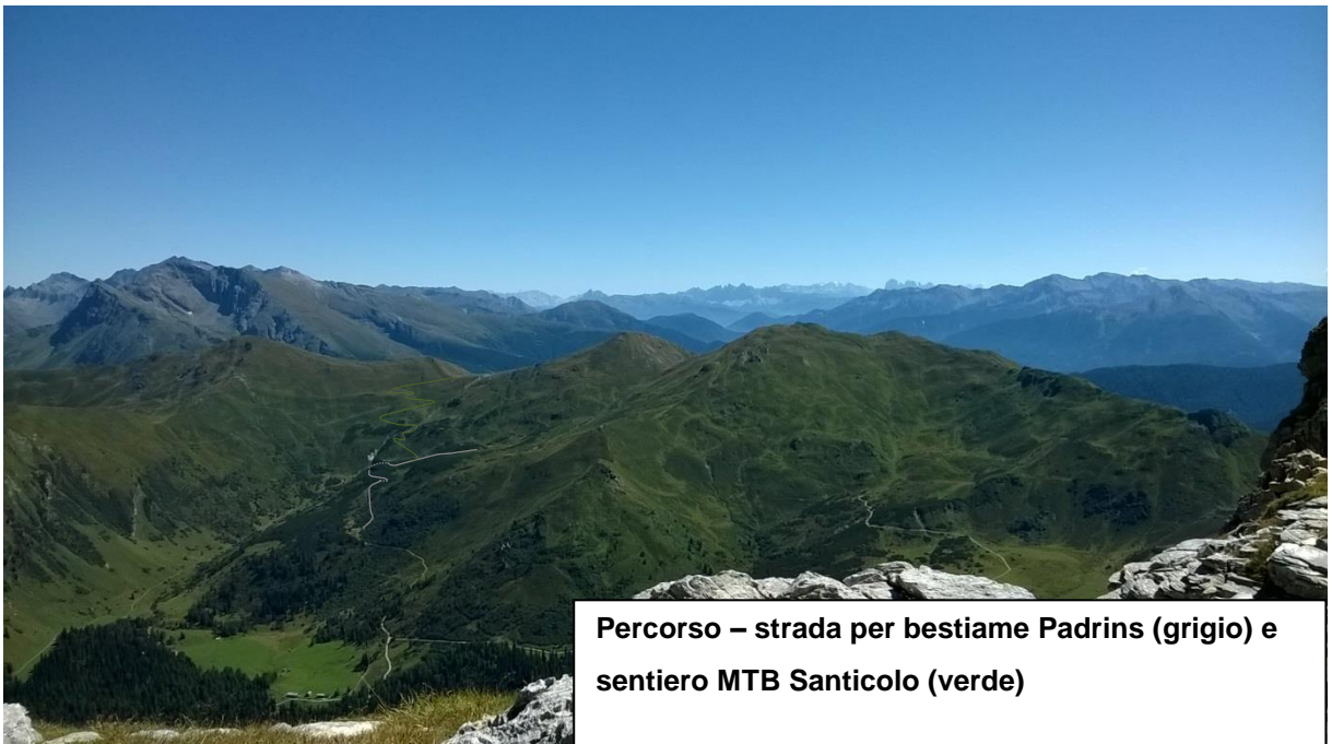
Percorso – strada per bestiame Padrins (grigio) e sentiero MTB Santicolo (verde)